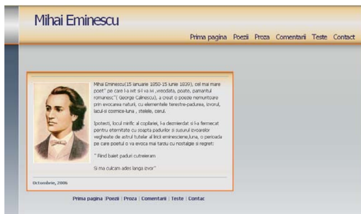
Figura 1. Prima pagină

Site-ul conține o descriere completă de informații despre viața și creațiile marelui poet: Mihai Eminescu. Site-ul conține o un text informativ despre Mihai Eminescu care se găsește pe “Prima pagina”, după care urmează fișierul “Poezii” care conține o serie de poezii împreună cu fișierele audio corespunzătoare fiecăreia. În felul acesta utilizatorul poate citi dar și asculta poeziile. Același lucru se întâmplă și în fișierul “Proza” și „Aprecieri critice” unde fiecare text corespunde unui fișier audio. Următorul fișier se numește “Teste” și are rolul de a evalua cunoștințele utilizatorului dobândite pe parcursul parcurgerii site-ului. Acesta se compune din trei teste, fiecare conținând cinci întrebări în care avem una sau mai multe variante corecte. Ultimul fișier numit: “Contact” are rolul de a oferi utilizatorului informații despre realizatorii site-ului.