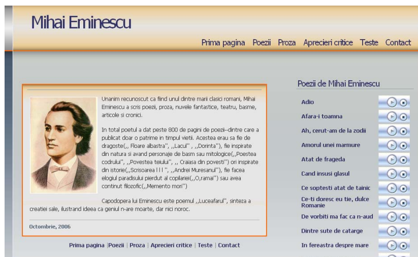
Figura 3. Poezii

Acest site a fost realizat cu ajutorul editorului de pagini Web: Macromedia Dreamweaver, a programului Corel Draw și Corel Photo Paint. Fișierele audio au fost prelucrate cu ajutorul programului Camtasia Studio. În plus, în acest site am utilizat funcții JavaScript la secțiunea de evaluare.